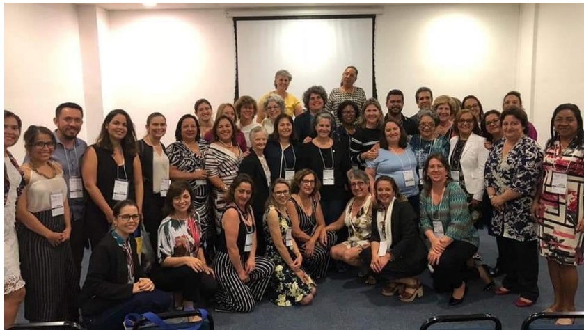
Figura 1 – Participantes da Reunião Ampliada COMSISTE ABEn Nacional e COMSISTE Seções da ABEn, realizada em Curitiba-PR, por ocasião do 70º CBEn.

Iniciando a reunião, a Coordenadora da COMSISTE ABEn Nacional dá as boas-vindas aos presentes, destacando a implantação de seis novas Comissões Permanentes de Sistematização da Prática de Enfermagem, desde junho de 2018, nas seguintes Seções da ABEn: Santa Catarina, Rondônia, Pernambuco, Mato Grosso, Rio Grande do Norte e Tocantins. Apresenta, aos participantes da reunião, a representante da ABEn Seção Piauí e da Seção Rio Grande do Sul, em que a COMSISTE está em franco processo de organização; e a representante da ABEn Seção Espírito Santo, cumprimentando-a tanto pelo soerguimento da Seção, como pelo início da organização da COMSISTE no estado.