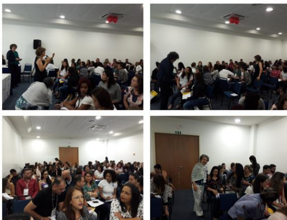
Figura 3 – Registro fotográfico do Workshop “Sistematização da prática de enfermagem e o uso de linguagens padronizadas na Atenção Básica”, realizado em Curitiba-PR, por ocasião do 70º CBEEn.